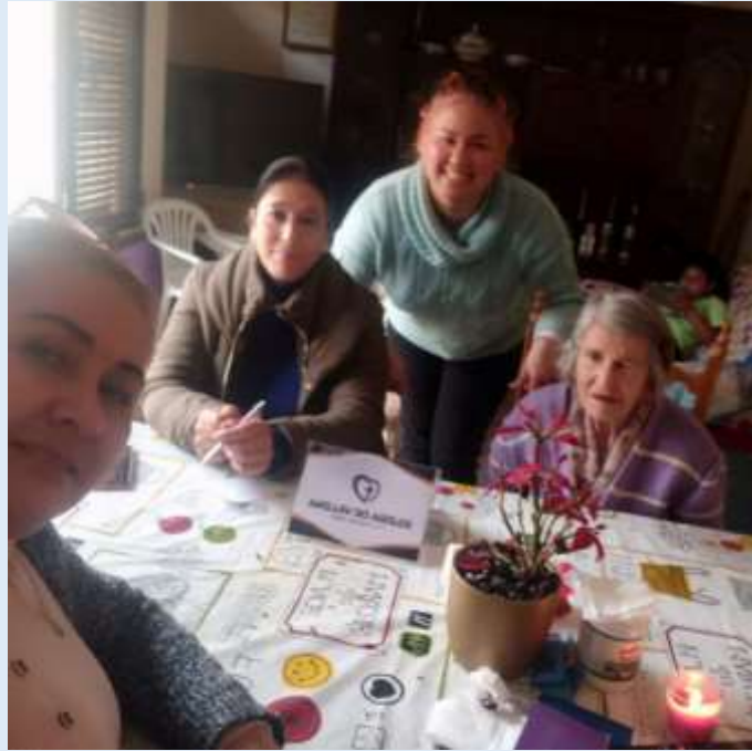
Kuvassa on yhden kolumbialaisen sisaren koti-kokous.