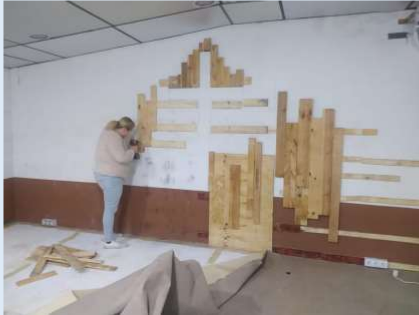
Siinä reippaana tyttönä irrottelen vanhan Alttarin seinää.