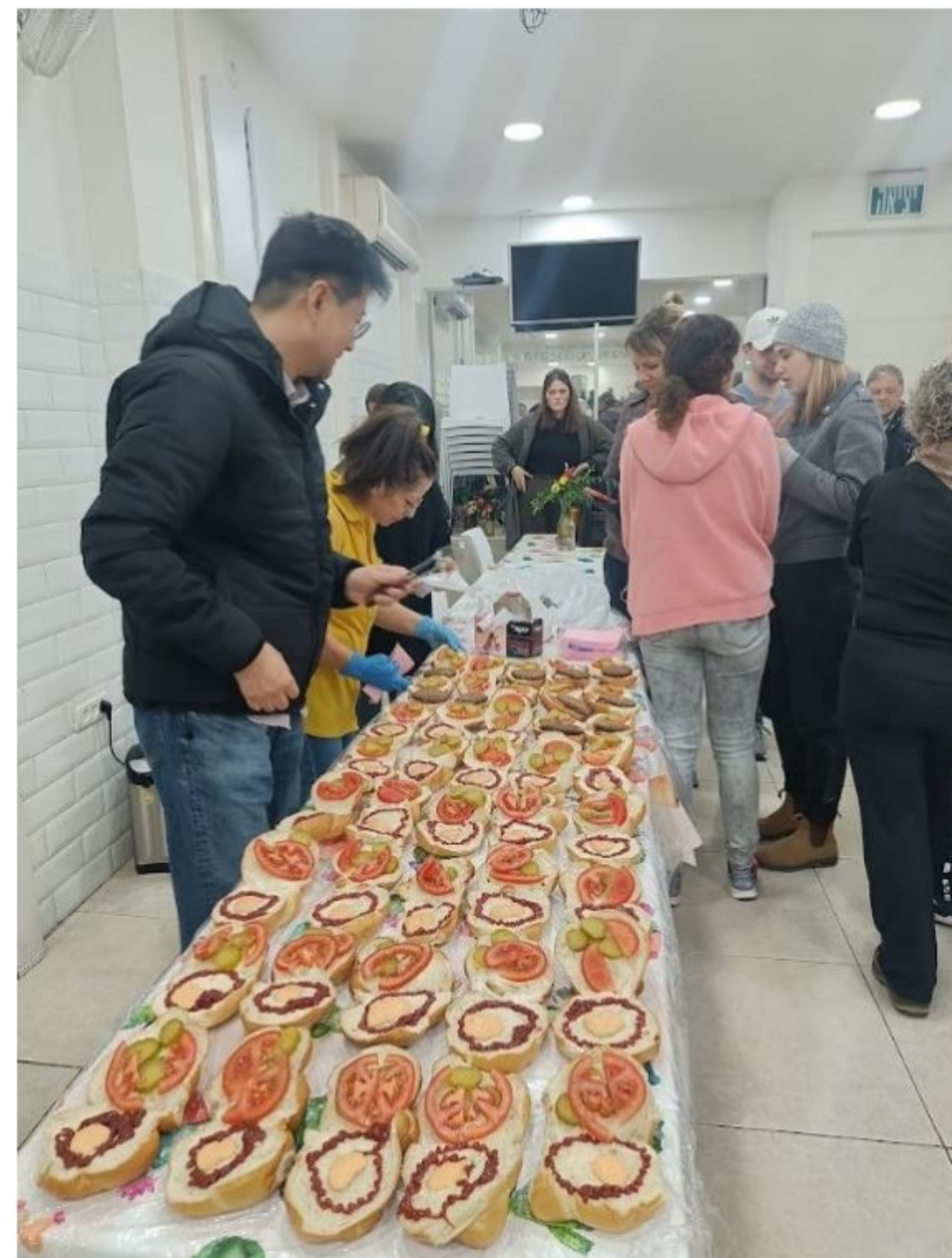
Sämpylöiden valmistelua kodittomien keittiöllä.